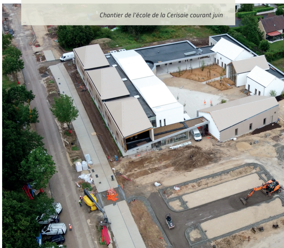
Chantier de l'école de la Cerisaie courant juin