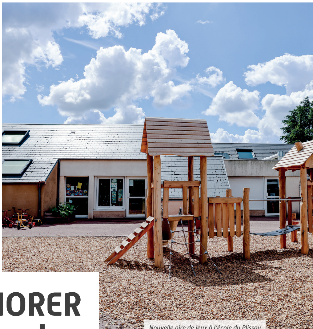
Nouvelle aire de jeux à l'école du Plissay