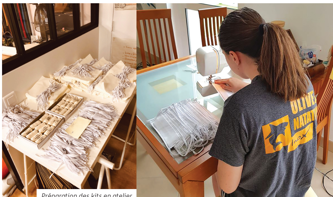
Préparation des kits en atelier

La mairie multiplie les sources d'approvisionnement pour fournir aux Olivetains des masques "grand public" en tissu : commandes, confection par des couturiers bénévoles, dons de collectivités. La distribution se prépare également.