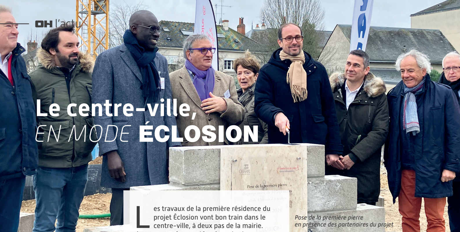
Pose de la première pierre en présence des partenaires du projet

La première pierre du projet Éclosion a été posée le 22 janvier. 39 logements sociaux sont en construction.