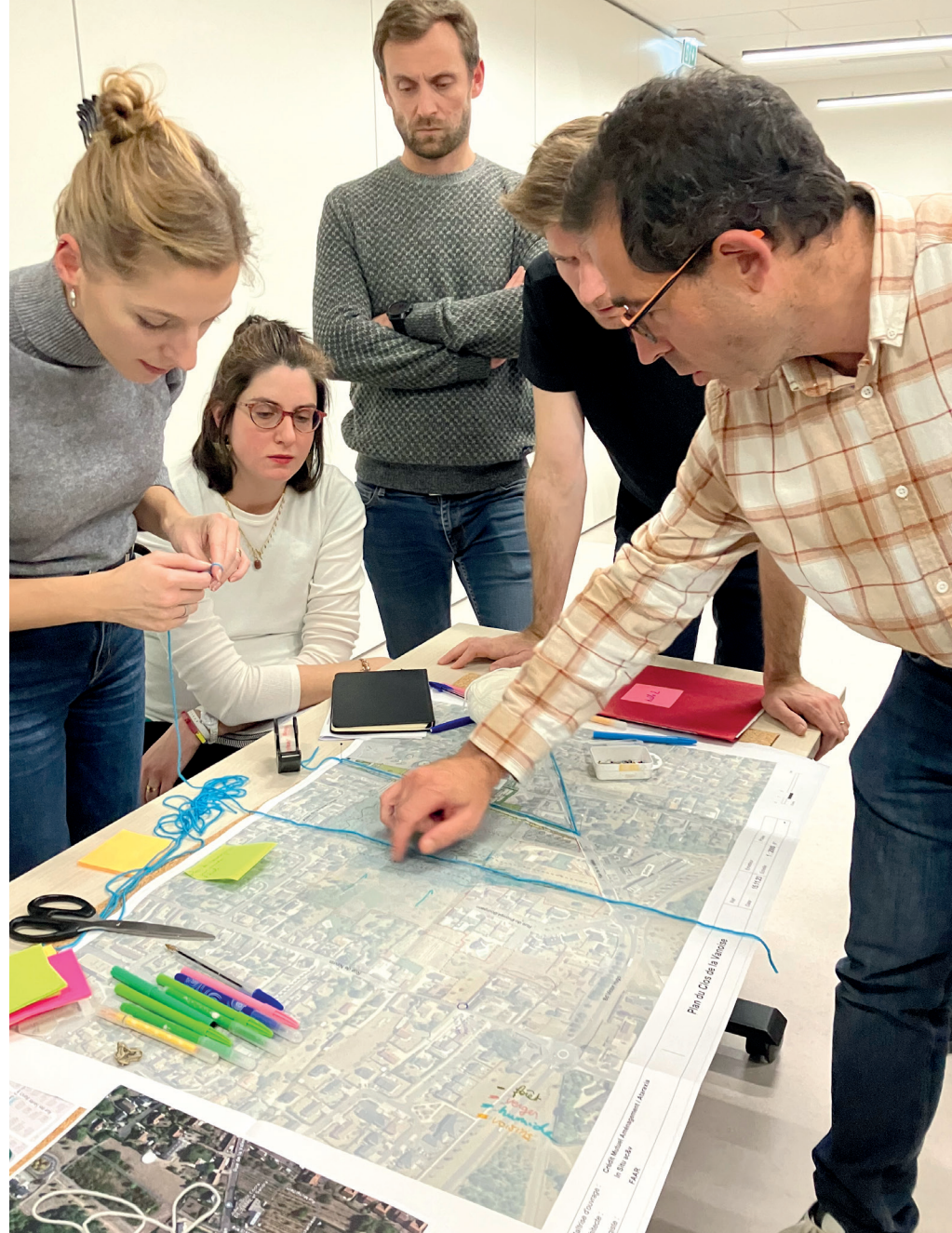
Les participants à l'atelier de la Vanoise travaillant sur les plans

Actuellement deux groupes de travail sont à l'œuvre. Un premier échange sur le Clos de la Vanoise. Une vingtaine de riverains du quartier y participent avec régularité pour coconstruire les fondements du futur permis d'aménager. Un second démarre ce mois-ci pour écrire la nouvelle page du prochain groupe scolaire du Val. En toute logique, il rassemble